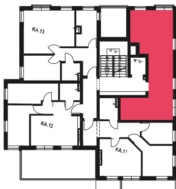
Schemat budynku klatka A 2 PIĘTRO