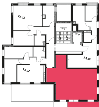
Schemat budynku klatka A 2 PIĘTRO