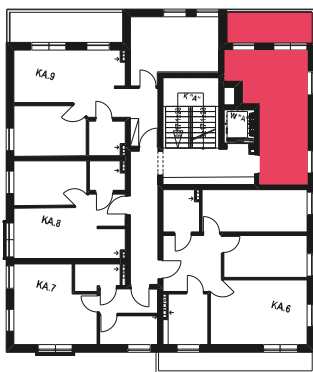
Schemat budynku klatka A 1 PIĘTRO