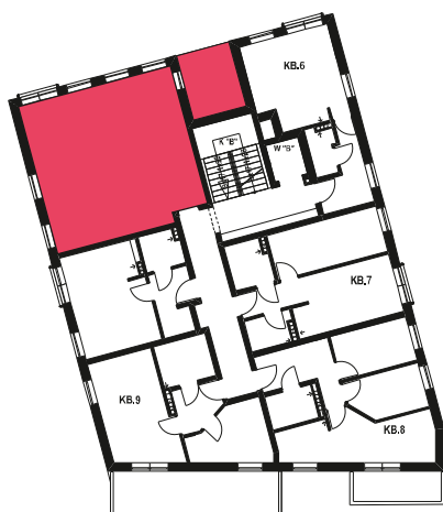
Schemat budynku klatka B 1 PIĘTRO