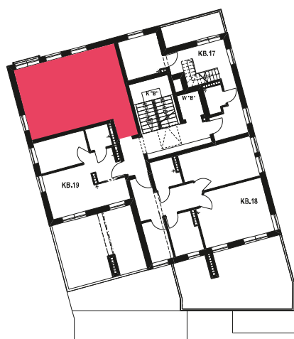
Schemat budynku klatka B 3 PIĘTRO