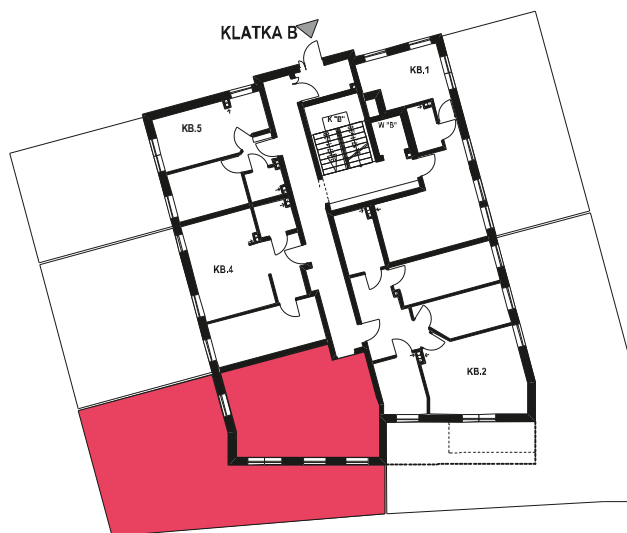
Schemat budynku klatka B PARTER