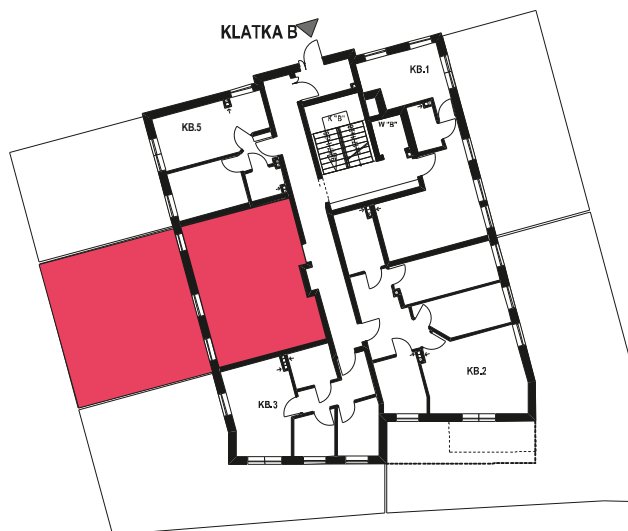
Schemat budynku klatka B PARTER