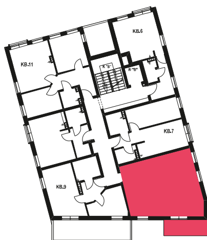
Schemat budynku klatka B 1 PIĘTRO