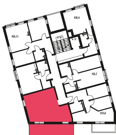
Schemat budynku klatka B 1 PIĘTRO