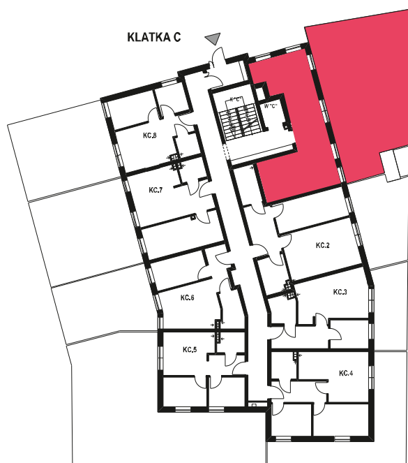
Schemat budynku klatka C PARTER