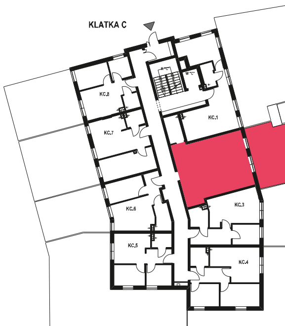
Schemat budynku klatka C PARTER