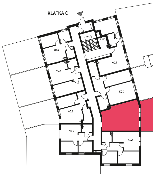
Schemat budynku klatka C PARTER