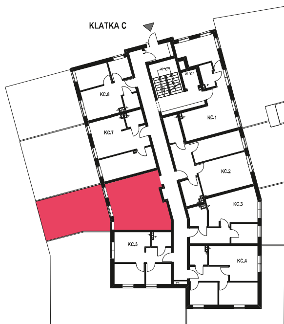
Schemat budynku klatka C PARTER