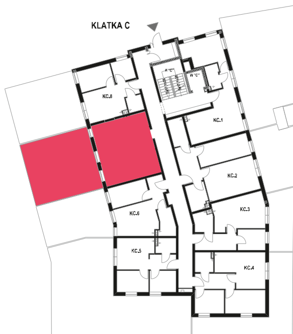
Schemat budynku klatka C PARTER