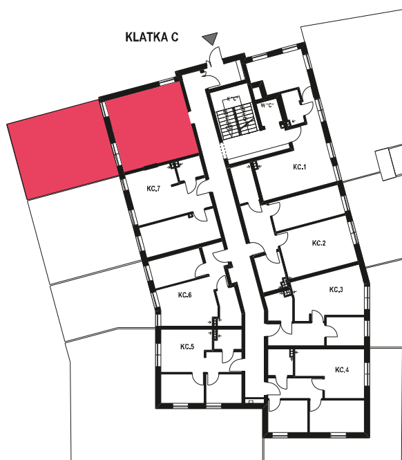
Schemat budynku klatka C PARTER